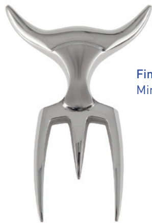
Finition poli-miroir Mirror-polished

David's holster is suitable for belt-carrying or storing the Tridens fork. It is made of thick European leather (2.8/3.0, vegetal tanned ), is assembled with golden brown tone-on-tone thread and has a snap fastener for easy closure. It is embossed with the Tridens logo on the front, the Audouin et Fils in Cholet 49 logo (our manufacturer) on the back above the belt loop and has a small blue-white-red border to remind its French manufacture . The pouch is presented in an elegant box berlingot format in kraft circled with a blue-white-red ribbon and the Tridens logo.