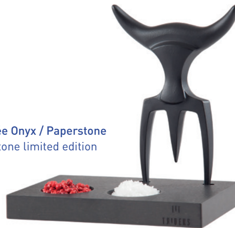
Edition limitée Onyx / Paperstone Onyx/Paperstone limited edition