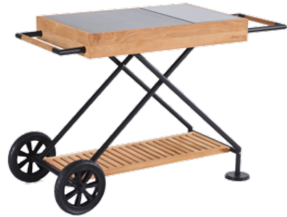
Basis model, Modèle de base Grundmodell, Basic model