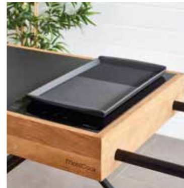
Grillplaat in gietijzer, plaque grill en fonte, gusseusen Grillplatte, cast iron grill plate Ref. 001.DPG.RIC