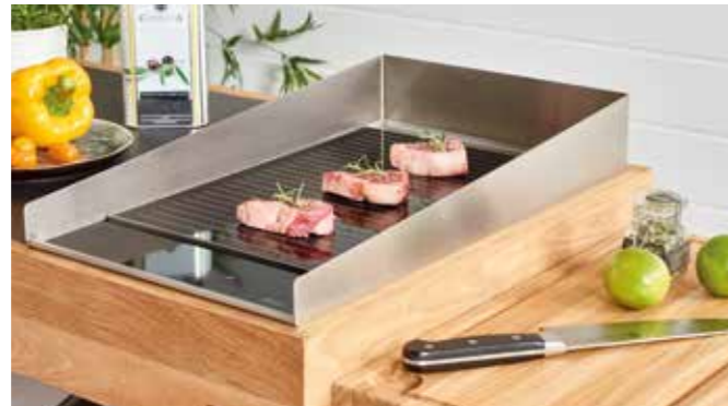
Antispatboard, Bord anti-éclaboussures, Anti-Sprizschutz, Anti splash board Ref. 130.041.310